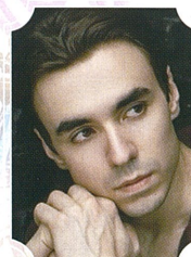
コスチャンチン・ツァプリカ