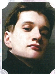
タラス・コブシュン